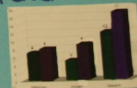
Legend: Boys (dark blue), Girls (light blue)

Uns ist aufgefallen, dass die Jungen mehr Gewaltspiele spielen, das ist wahrscheinlich so, weil sie öfter in Konflikte geraten als Mädchen und Mädchen deswegen eher ruhigere Spiele spielen.