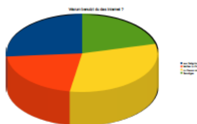
Welche Informationen holst du dir aus dem Internet?